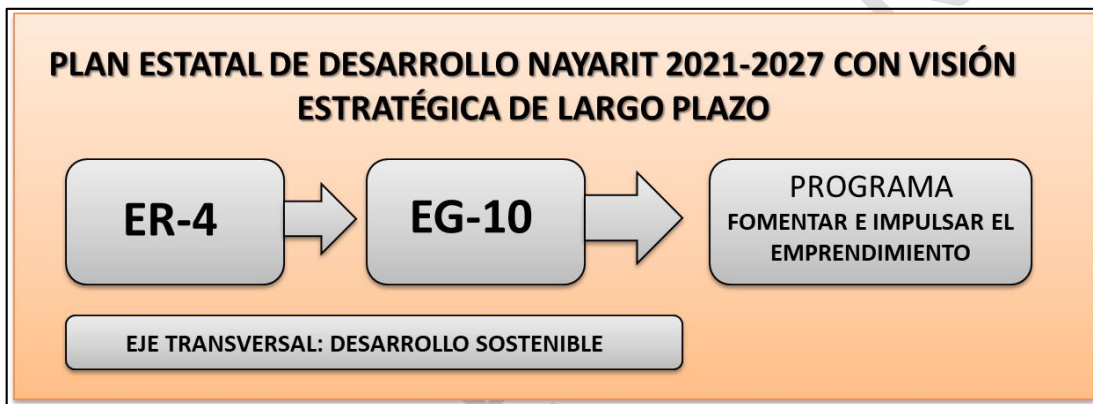
Ilustración 4 Origen el Programa Sectorial

En la siguiente ilustración se describe el origen del programa sectorial FIE