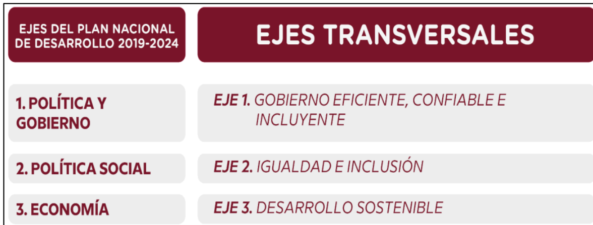
Ilustración 3 Ejes transversales del Plan Estatal de Desarrollo Nayarit 2021–2027 con Visión Estratégica de Largo Plazo alineados al Plan Nacional

Los Objetivos del Desarrollo Sostenible que contribuyen de manera directa o indirectamente en este programa sectorial FIE y abonan al Plan Estatal de Desarrollo Nayarit 2021–2027 con Visión Estratégica de Largo Plazo son: